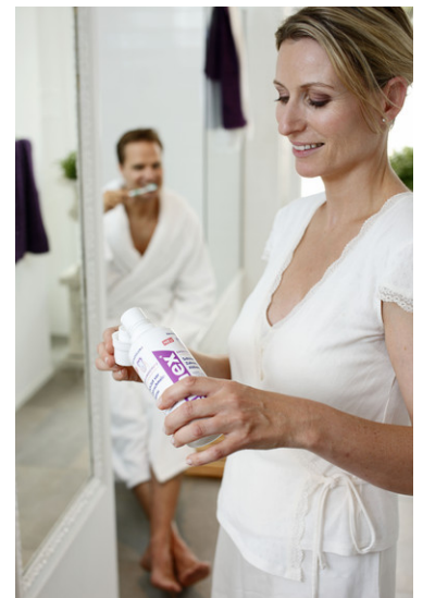
Schutz vor säurebedingten Zahnerosionen